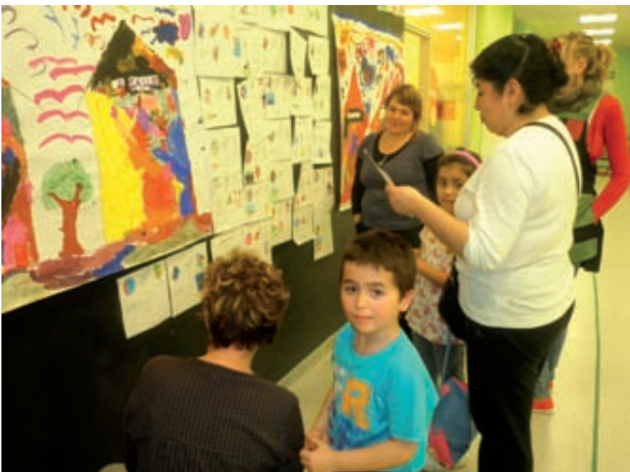
Beasaingo ludotekako haur eta gurasoak euren ingurunea marrazkien bidez azaltzen.

Ikastetxeak eta ni: herrian dauden ikastetxeak ezagutu nahi izan genituen. Horrela, haurrek aukera izan zuten herrian, euren ikastetxeaz gain, gehiago ere badaudela ikusteko eta ikastetxe guztietako haurrak lagun dituztela ikusteko. Horma-irudi erraldoi bat egin genuen, herriko lau ikastetxeak margotuz, eta, ondoren, bakoitzak bere ikastetxea zein zen azaldu zuen. Horma-irudi handi hori etxear irudien aldamenean ezarri genuen.