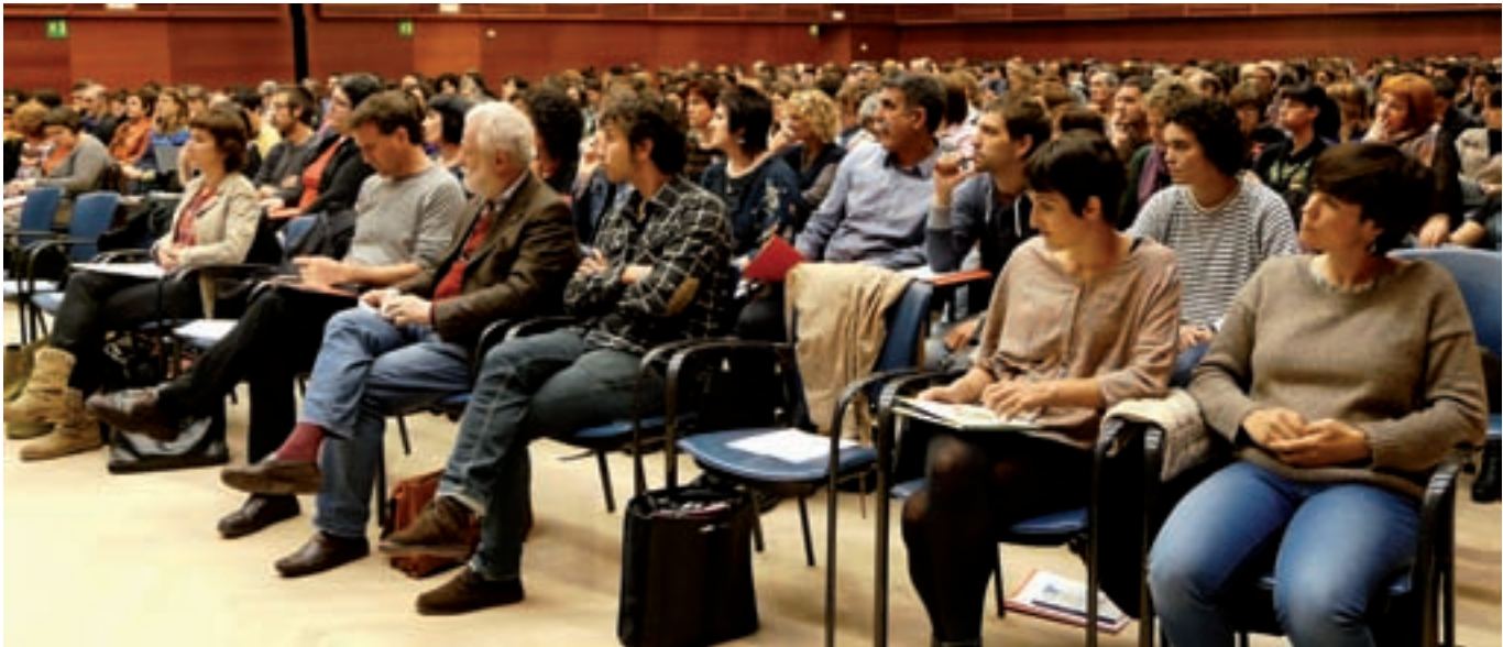
Kursaaleko aretoa lepo bete zen ostiralean eta larunbatean, 'Herri hezitzailea, eskola herritarra' jardunaldietan.