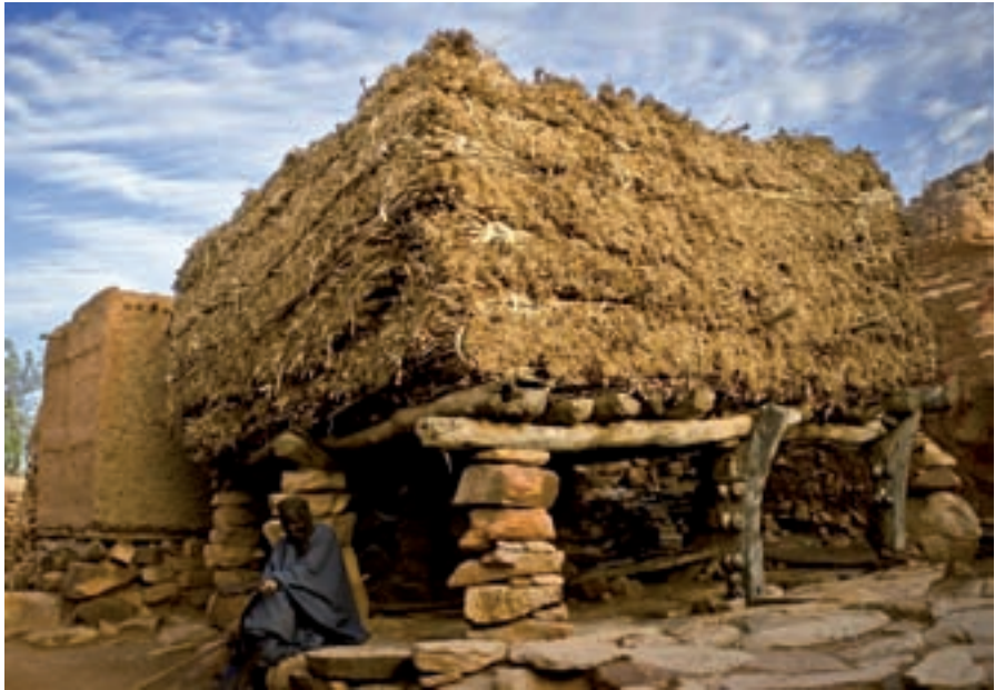
Maliko Hitzaren Etxeetako bat.