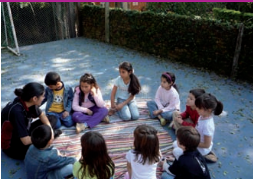
Haurrak eta irakaslea maila berean eta borobilean eserita jartzen dira elkarriketa filosofikoan

Beste behin, heriotzari buruzko ariketa bat landu zuen Camisonek, batetik nerabeekin, eta bestetik helduekin. Heriotzari buruzko film labur mexikar bat ikusi zuten.