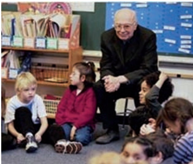
Matthew Lipman izan zen Haur Filosofiaren sortzailea. “Euren kabuz pentsatzen duten pertsona helduak nahi baditugu, euren kabuz pentsatzeko gai diren haurrak hezi behar ditugu”, zioen Lipmanek.