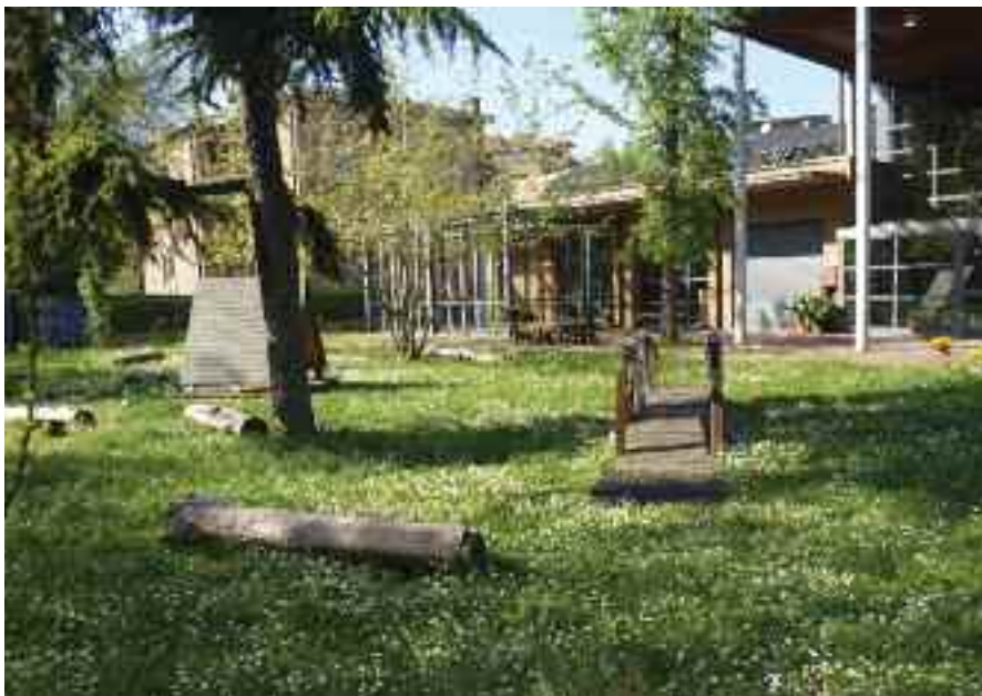
Gianni Rodari 0-3 haur eskolaren kanpoko aldea.

aren eta elkarriketaren bidez, eskola elikatu egiten da eta etengabe eraldatuz eta eraikiz doa. Topaketa filosofiko edota teorikoak egin ohi dituzte, baina baita bestelakoak ere. Familiak eskolara joaten dira laguntzera: adibidez, eskolarako behar diren mahai edo bestelako altzariak egitera edo kontontzera, sukaldean aritzera, materiala prestatzera... azken batean, era bateko edo besteko ardurak hartzen dituzte komunitatearen barruan. “Arduraren kontua oso garrantzitsua da guretzat. Izan ere, gure esperientziaren oinarri filosofikoetarikoa bat da. Familien eta publikoa den horren arteko lankidetzaren nola bultzatu gogoeta egiten dugu etengabe. Familiak euren errentaren arabera kuota bat ordaintzen dute, baina horrez gain, aukera daukate lanaren bitartez, praktikak eginez edota tailer eta hitzaldietan parte hartuz eskolako partaide izateko, eta bide batez, loturak sendotzeko”.