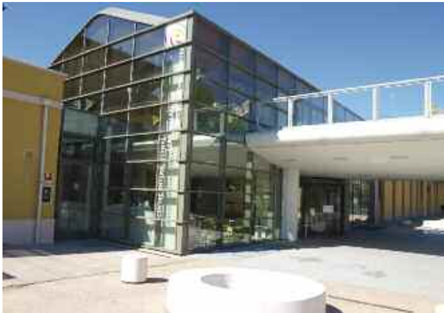
Reggio Children nazioarteko gunea goran, eta Reggio Emilia hiriaren erdialdeko plaza bat behean.

Bi oinarri horiek kontuan izanik — haurrak berezko gaitasunak dituelako jakintza autoerakitzen duela eta besteekin harremanetan egotea bilatzen duela— eraikitzen dute Reggio Emilian eguneroko jarduna. Talde-lana eta kalitatezko arreta indibidualizatua uztartzen saiatzen dira. Horretarako askatasuna da euren jardunaren giltzarrietako bat. Erreferentziazko testuingurua egoki landua eta osatua badago, haurrak gai izango dira bakarrik aritze-