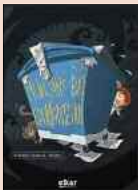
Munstro bat edukiontzian